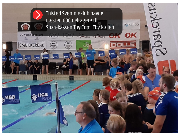
Thisted Svømmeklub havde næsten 600 deltagere til Sparekassen Thy Cup i Thy Hallen