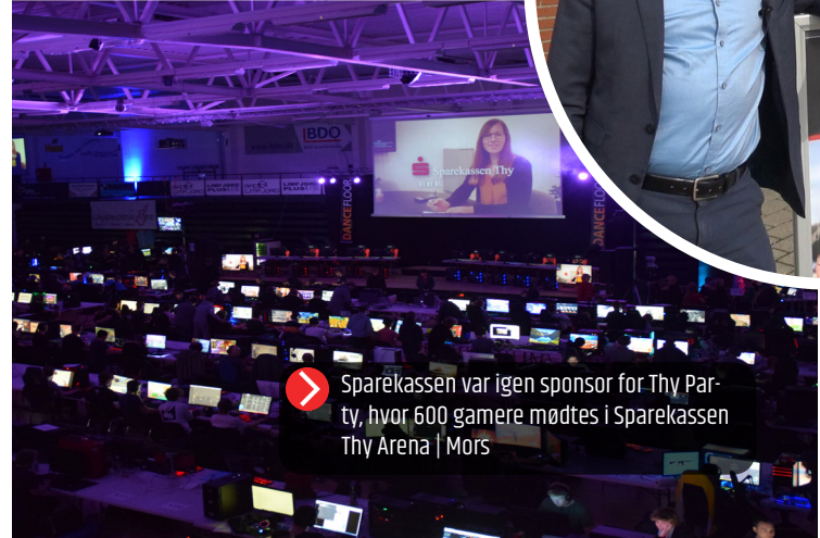
Sparekassen var igen sponsor for Thy Party, hvor 600 gamere mødtes i Sparekassen Thy Arena | Mors