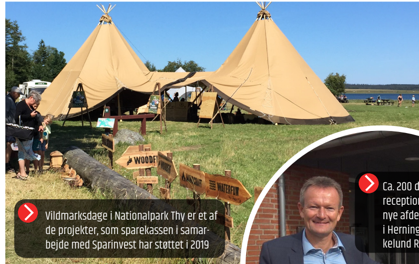
Vildmarksdage i Nationalpark Thy er et af de projekter, som sparekassen i samarbejde med Sparinvest har støttet i 2019