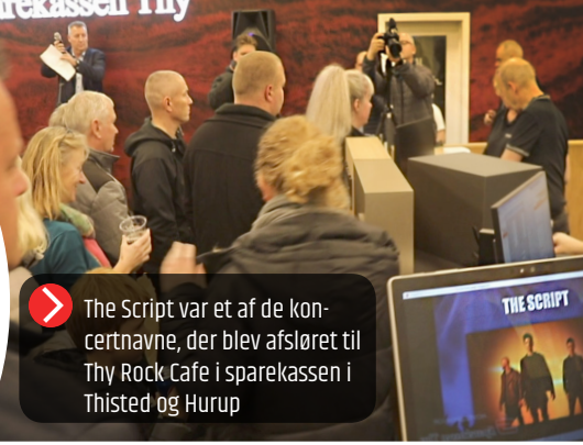
The Script var et af de koncertnavne, der blev afsløret til Thy Rock Cafe i sparekassen i Thisted og Hurup