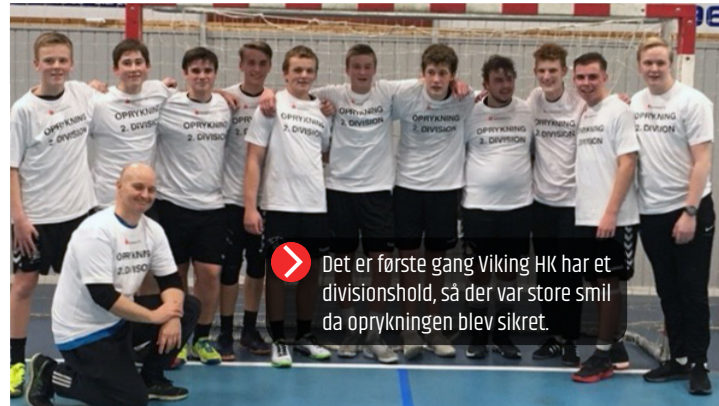
Det er første gang Viking HK har et divisionshold, så der var store smil da oprykningen blev sikret.