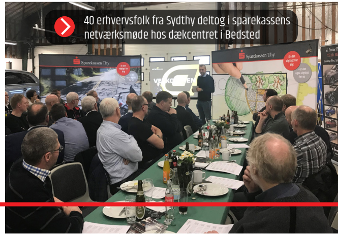
40 erhvervsfolk fra Sydthy deltog i sparekassens netværksmøde hos dækcentret i Bedsted