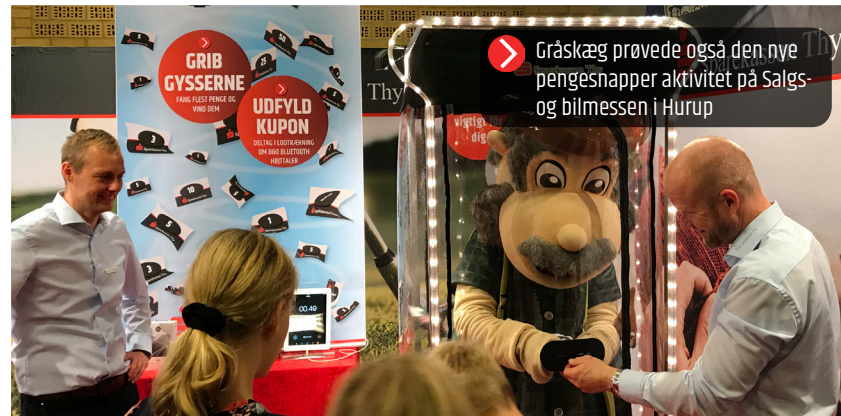
Gråskæg prøvede også den nye pengesnapper aktivitet på Salgs- og bilmessen i Hurup